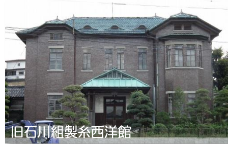
旧石川組製糸西洋館

また、西洋館も 1 階に加えて、一般公開でも限定でしか見学できない 2 階や細部まで時間をかけて見ていただけるように企画しています。