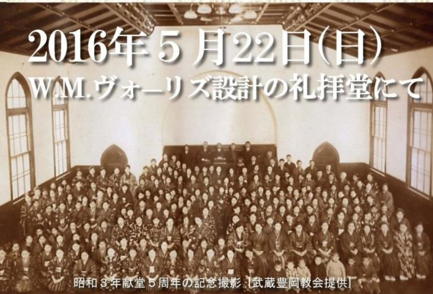
昭和8年献堂50周年の記念撮影