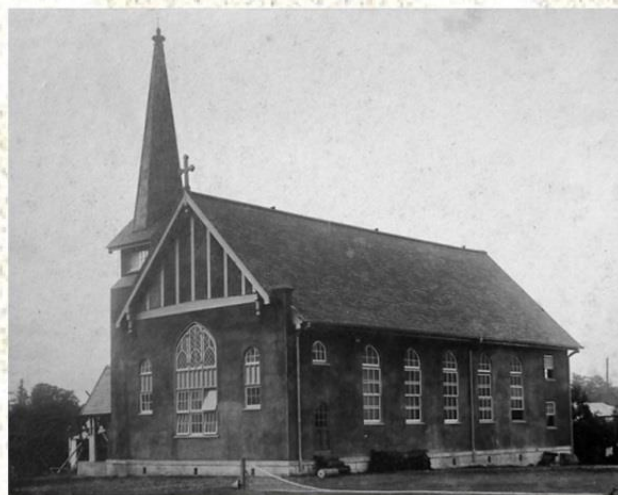
大正12年竣工直後の様子

【申込み方法】 必要事項（参加者最大3名までの氏名、返信用の代表者連絡先（住所、メールアドレスあるいは電話、FAX番号）を記入の上、メールあるいは当会ホームページのメールフォーム、FAX、はがきにて、申込み期間内にお申し込みください。受付票をお送りいたします。